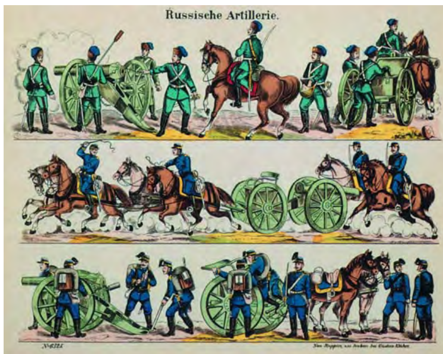
Русская артиллерия. Гравюра. XIX в.

Одна овечка опаршивает, и цело стадо оплешивет Если вздохнуть всем миром — ветер будет Один и камень не поднимешь, а миром город передвинешь