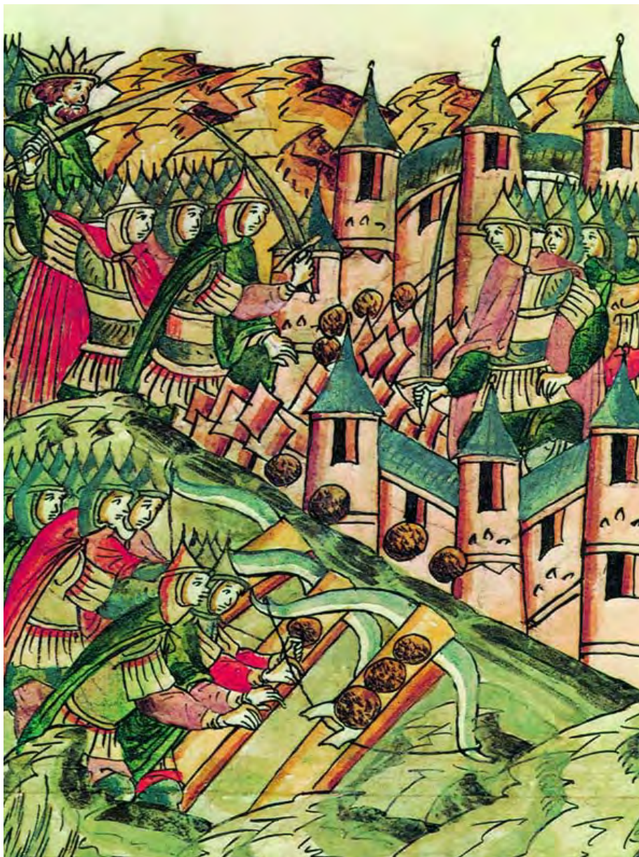
Сражение с ордынцами у стен Козельска. 1237 г. Миниатюра. XVI в.